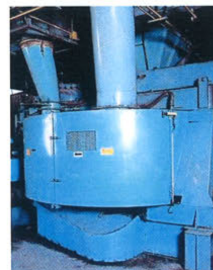
アイリッヒミキサー DW2914