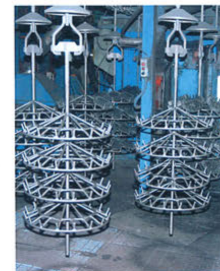
ハンガーショットブラスト