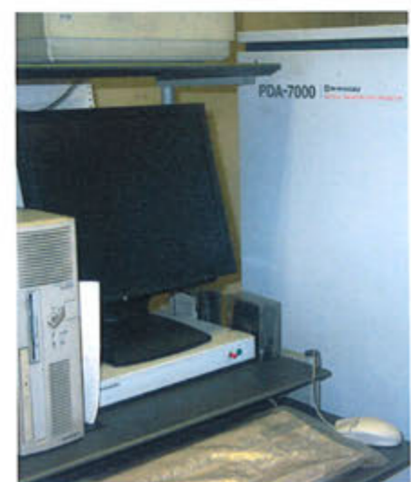
発光分光分析装置