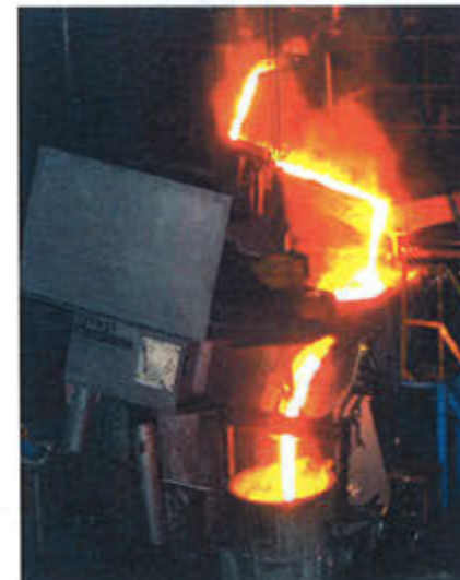
キューボラ→保持炉→大取鍋

発光分光分析装置 PDA-7000 1基 金属顕微鏡 1台 万能試験機 1基 ロックウエル硬度計 1台 プリネル硬度計 1台