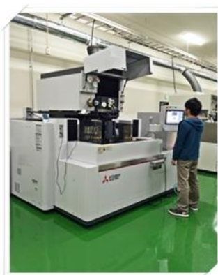
ワイヤー放電加工機