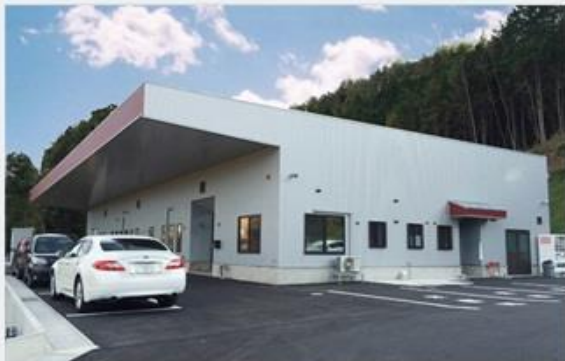
第一工場(ワイヤー)