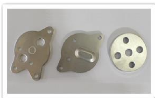
アルミ材 板圧5mm プレス