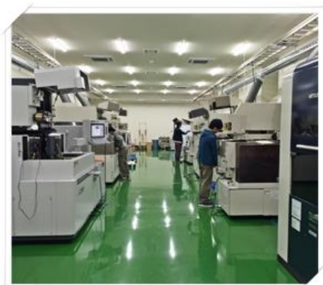
第一工場 (ワイヤー室)