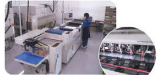
ホールチエッカー