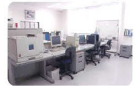
データ(プログラム)作成室