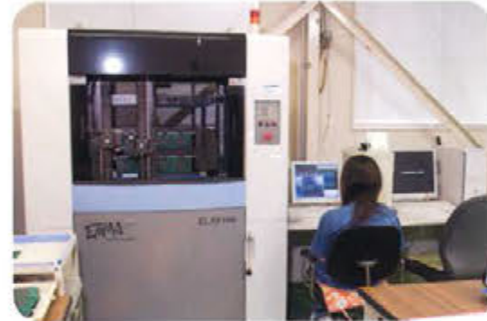
フライングチェッカー