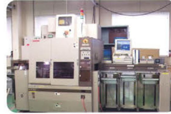
自動チェッカー機