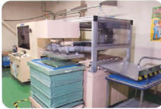
オートシャーリング