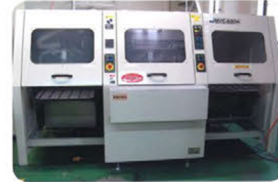
マルチVカットマシン